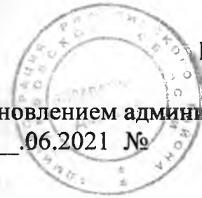
График приемки готовности муниципальных образовательных организаций началу нового 2021 - 2022 учебного года

Приложение № 2 Утвержден постановлением администрации района от ____ .06.2021 №