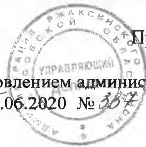
График приемки готовности муниципальных образовательных организаций началу нового 2020 - 2021 учебного года

Приложение № 2 Утвержден постановлением администрации района от 15.06.2020 № 307